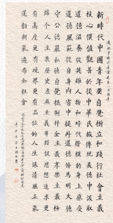
▲习近平总书记讲话节选 王元林